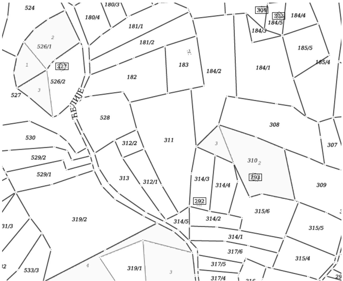
Графички прилог 1. - Копија плана број 952-04-005-5710/2024 од 26.03.2024. године