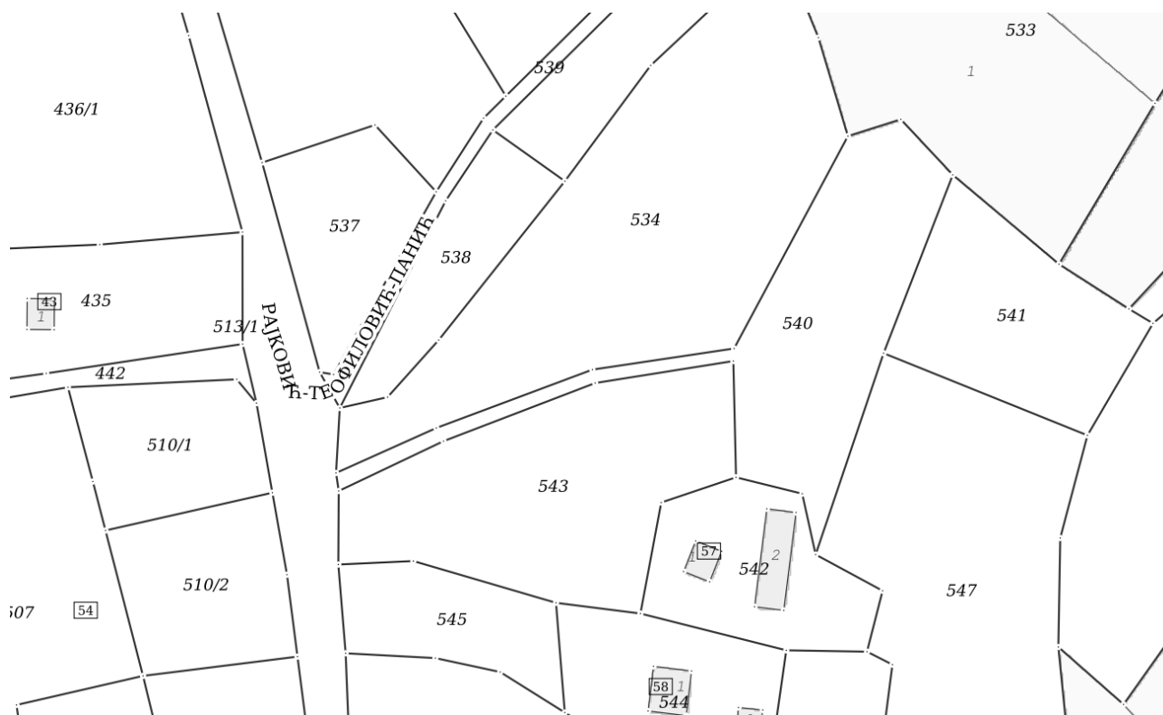
Графички прилог 1. Копија плана број 952-04-005-27018/2023 од 29.12.2023. године