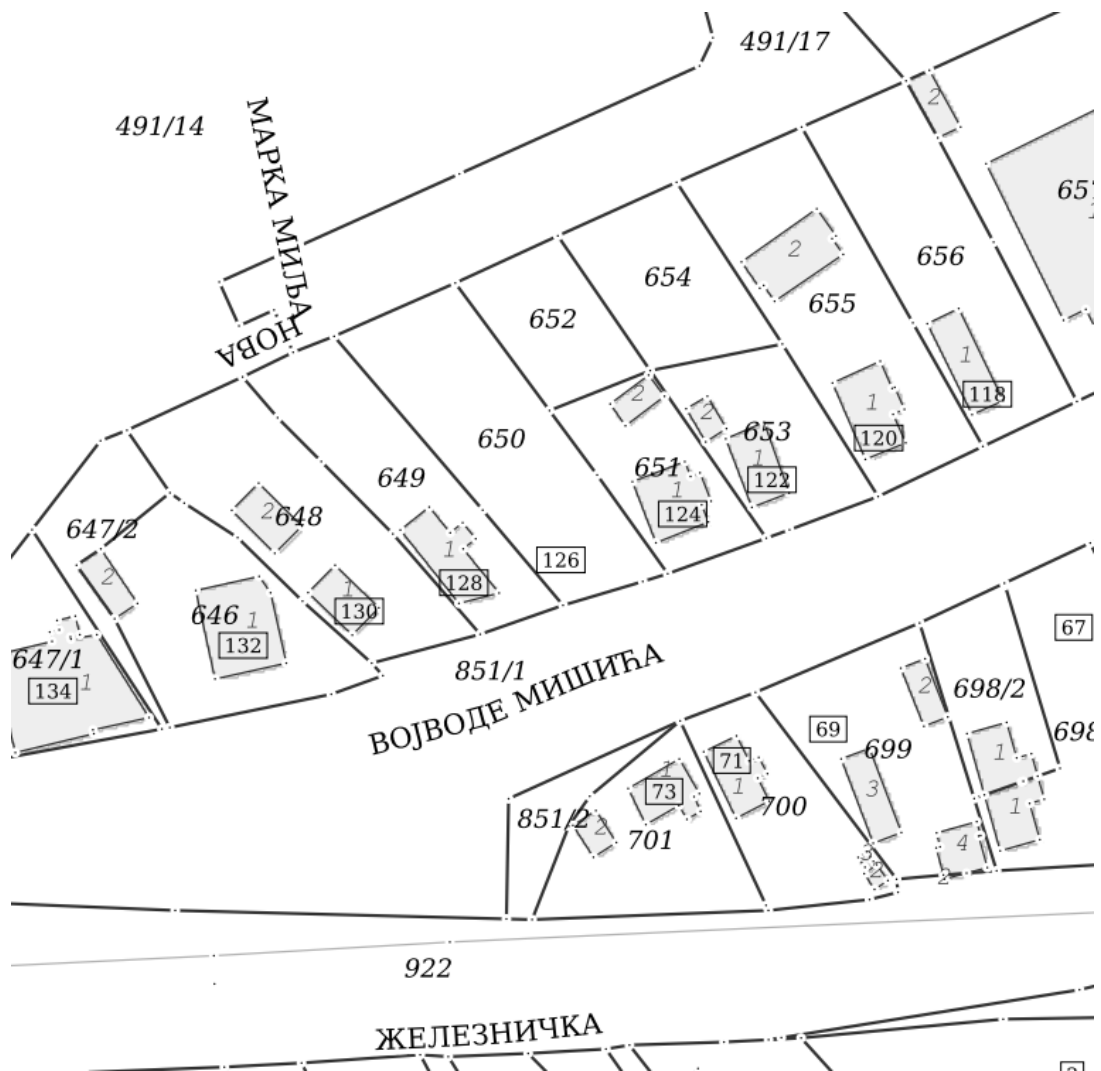
Слика 2. - Копија катастарског плана број 953-2-005/2021-10 од 01.04.2021. године